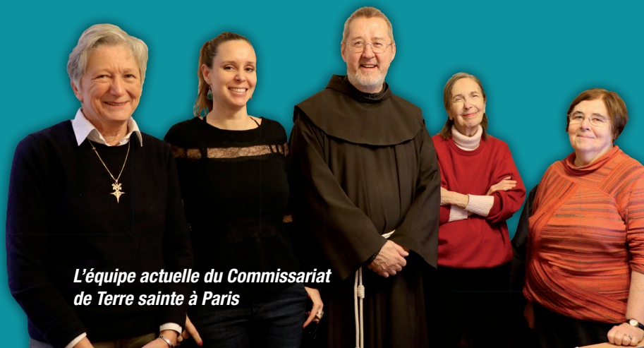
L'équipe actuelle du Commissariat de Terre sainte à Paris

Adresse du Commissariat : 7 rue Marie Rose 75 014 PARIS Email : cts@franciscains.fr Site Internet : www.vendredisaint.franciscains.fr Téléphone : 01 45 40 86 21 (mardi et mercredi) Compte bancaire pour virement : IBAN : FR32 20 04 10 00 01 00 23 80 7 h 02 09 5 BIC : PSSTFRPPPAR